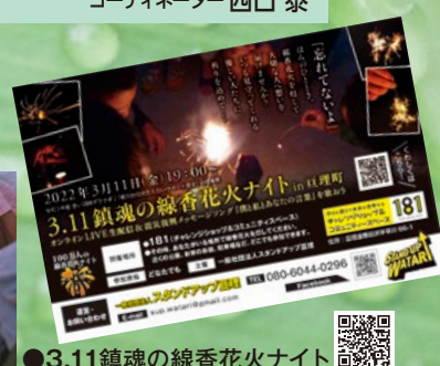
●3.11鎮魂の線香花火ナイト